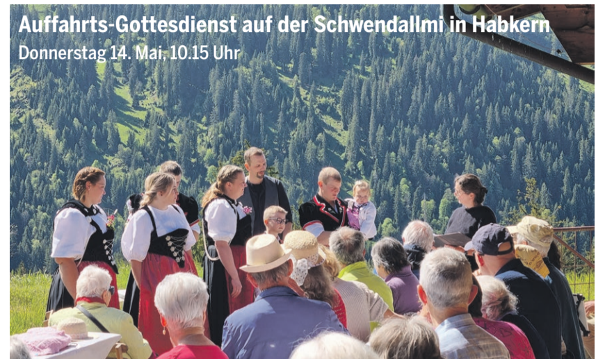
Schwendallmi-Gottesdienst 2025 mit Taufe

Auffahrts-Gottesdienst auf der Schwendallmi in Habkern Donnerstag 14. Mai 10.15 Uhr