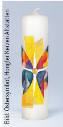
Bild: Ostersymbol, Hongler Kerzen Altstätten

Alle Jahre wieder an Ostern wird unsere Osterkerze erneuert. Sie brennt anschliessend das ganze Jahr hindurch an Gottesdiensten, Beerdigungen oder auch am Fyre mit de Chlyne. Dieses Jahr findet sich auf unserer Kerze das Motiv des Schmetterlings. Es ist ein Symbol für das, was wir im Christentum unter Ostern oder auch der Auferstehung verstehen.