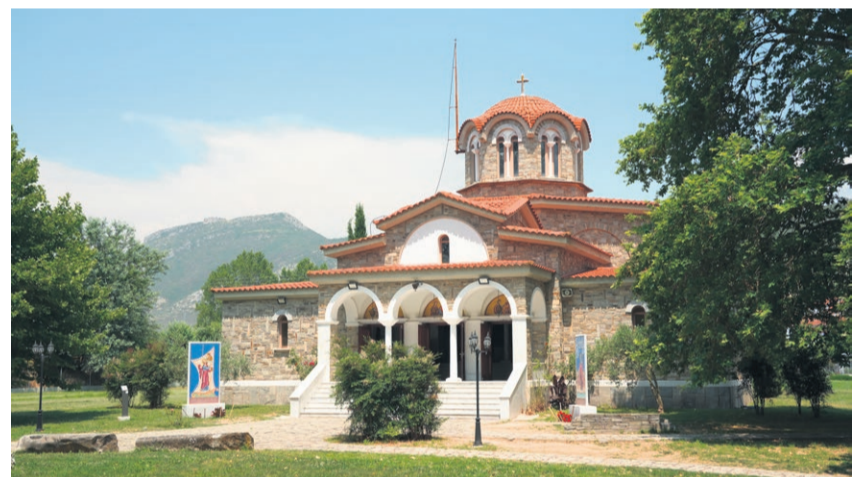
Heutige Taufkapelle der Heiligen Lydia am Zygaktis-Fluss