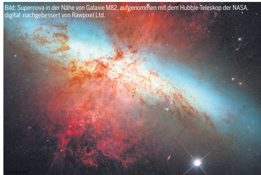
Bild: Supernova in der Nähe von Galaxie M82, aufgenommen mit dem Hubble-Teleskop der NASA, digital nachgebessert von Rawpixel Ltd.