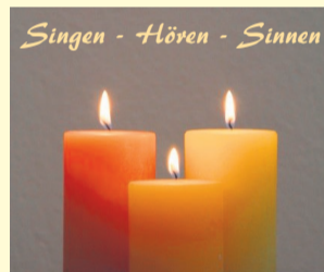
Singen - Hören - Sinnen