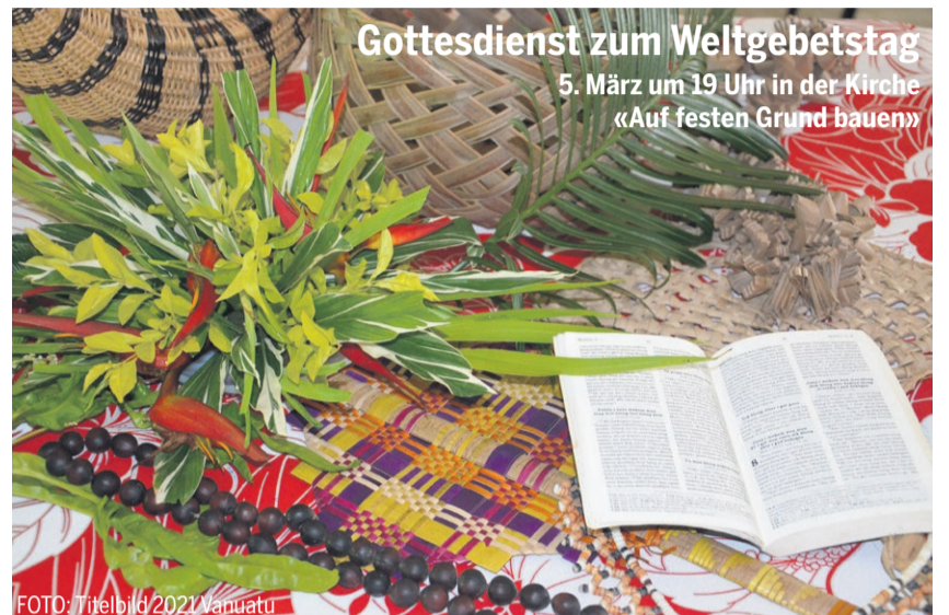
FOTO: Titelpild 2021 Vanuatu