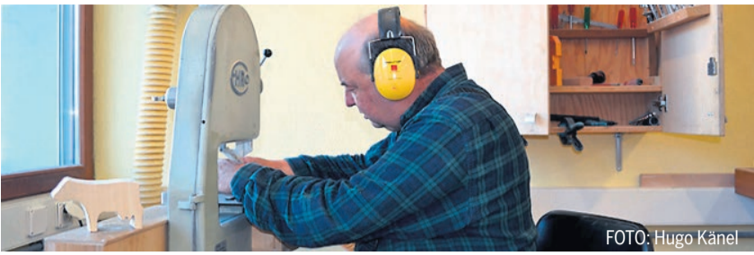
Arbeit in der Schreinerei Zemi